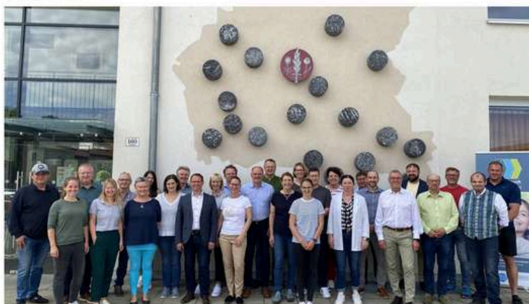
Teilnehmer aus fast allen Mitgliedsgemeinden sind zur Infoveranstaltung gekommen.

Die Klima- und Energiemodellregion (KEM) 'Klimazukunft Oberinnviertel' hat am 6. Mai eine informative Veranstaltung zum Thema "Kreislaufwirtschaft und Ressourceneffizienz in Gemeinden" in Tarsdorf organisiert.