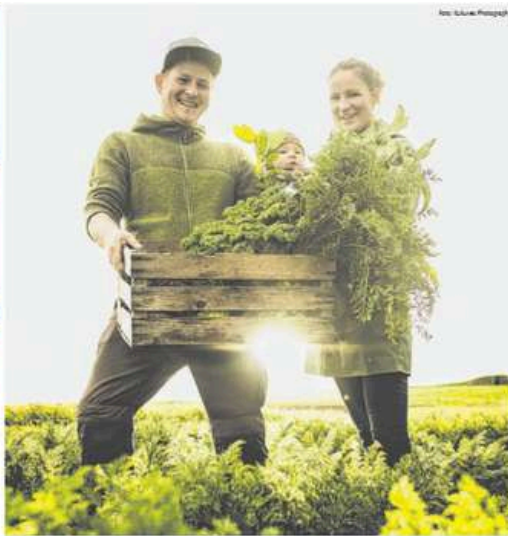
Sommerfest Das Sacherl Tannberg in Lochen lädt in Zusammenarbeit mit der Klimazukunft Oberinnviertel am 6. September zum Sommerfest ein. Besucher haben die Gelegenheit, mehr über die solidarische Landwirtschaft zu erfahren. www.sachertannberg.at