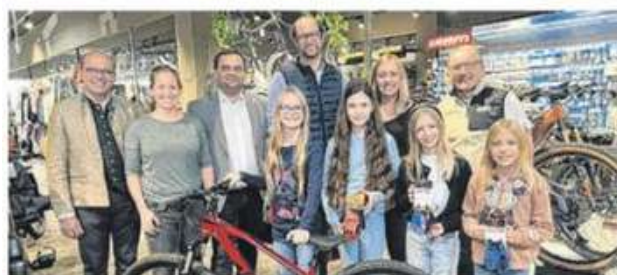
Die Gewinnerin bekam ein neues Fahrrad.

Eine Anmeldung ist unter anmeldung@kem-om.at erforderlich. ■