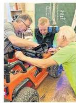
Seit der Gründung vor einem Jahr wurden 72 Geräte vor dem Weggelassen bewahrt.

LOCHEN. In der Mittelschule Lochen wurde wieder fleißig geschraubt, gelötet und genäht: Seit der Gründung des Repair Cafés Lochen vor einem Jahr konnten an drei Terminen 72 Reparaturen durchgeführt werden. Das nächste Repair Café findet am 15. März 2025 statt.