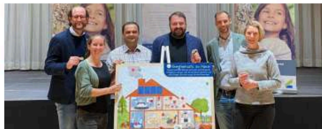
Die Reise der Wanderausstellung „Klima Kinder“ hat begonnen.

BEZIRK BRAUNAU. Eine neue Wanderausstellung zum Thema Erde und Klima für Kinder im Alter von etwa sechs bis zwölf Jahren macht in den nächsten Wochen an verschiedenen Volksschulen im Bezirk halt.