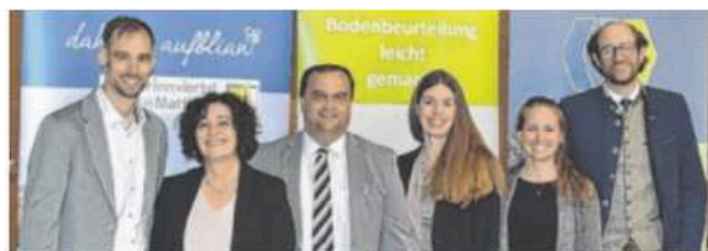
Das Leader- und KEM-Team stellte bei der Versammlung Projekte vor.

Referenten von Bio Austria, Brot und Ruam (Aspach) sowie Sacherl Tannberg (Lochen) gehen auf die unterschiedlichen Konzepte ein und berichten über Wissenswertes und Praxiserfahrungen. Die Teilnahme ist kostenlos. Eine Anmeldung ist unter https://mitten-im-innviertel.at erforderlich. ■